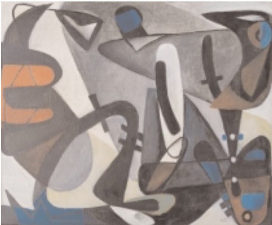
Georg Meistermann, 1911 Solingen –1990 Köln Instrumentation, 1953 Öl auf Leinwand, 51 x 60 cm sign., Herold 286