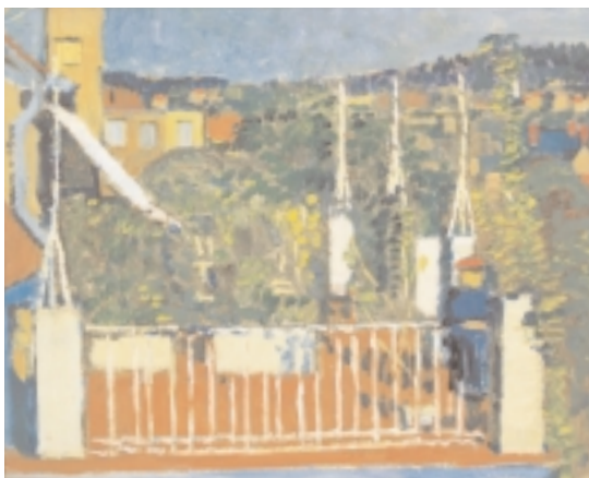
Alfred Heinrich Pellegrini, 1881 Basel –1958 Basel Blick auf einen Balkon, 1910 Öl auf Karton, 27,5 x 36,4 cm verso monogr. und dat. Überwasser I 5, Leber, S. 64