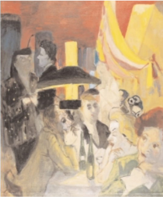
Wilhelm Schnarrenberger, 1892 Buchen/Baden –1966 Karlsruhe Kaffeehausszene, 1952 Öl auf Leinwand, 78 x 64 cm sign. und dat.