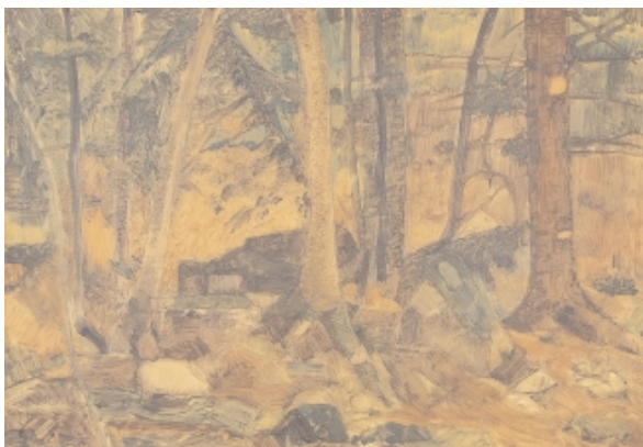
Oskar Schlemmer, 1888 Stuttgart –1943 Baden-Baden Waldinneres, um 1940 Öl auf Ölpapier, auf Pappe, 25 x 35,2 cm Echtheitsbestätigung Karin von Maur Studie für die Ausmalung des Speisesaals der Firma K. Martin in Offenburg