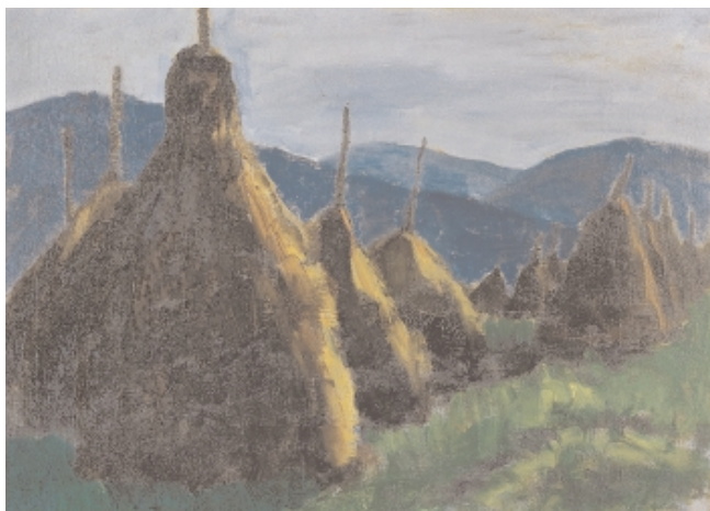
Gabriele Münter, 1877 Berlin –1962 Murnau Heuhocken im Moor Öl auf Leinwand, 70,5 x 51 cm verso Nachlassstempel, auf dem Rahmen Ausstellungsetikett: Laguns beach Museum of Art/Gabriele Münter Exhibition Jan 10 to Feb 28, W.Nr. L45