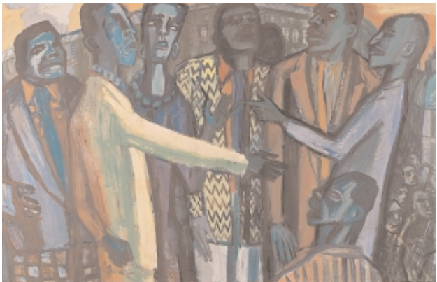
Karl Hubbuch, 1891 Karlsruhe –1979 Karlsruhe Afrika wird unruhig, 1961 Öl auf Holz, 60 x 94 cm verso sign. und bet.