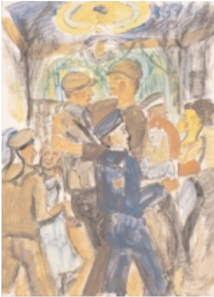
Erich Heckel, 1883 Döbeln/Sachsen –1970 Radolfzell Tanzende, 1917 Deckfarben über Aquarell und Kohle, 52 x 37,9 cm sign., dat. und bet.