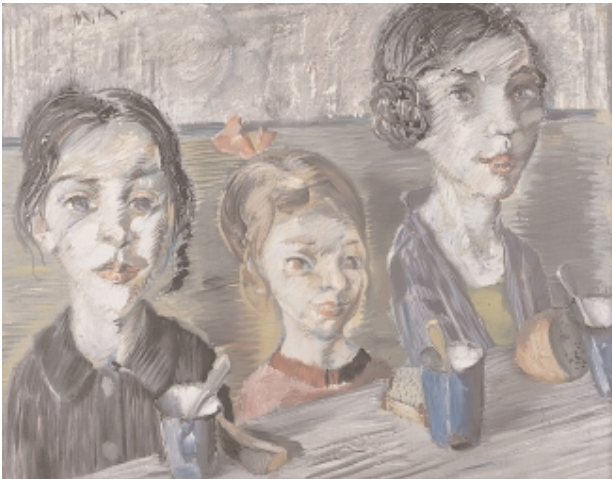
Max Ackermann, 1887 Berlin –1975 Unterlengenhardt Drei Kinder, 1924/25 Öl auf Leinwand, 73 x 94 cm monogr.