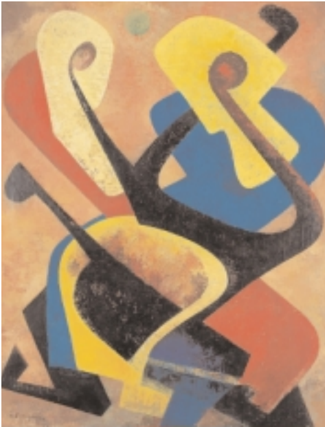
Wilhelm Imkamp, 1906 Münster/Westf. –1990 Stuttgart Burleske, 1951/52 Öl auf Leinwand, 91 x 71 cm sign. und dat., Schönfeld-Dörrfuß 254