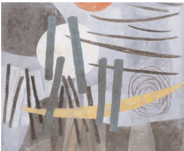
Willi Müller-Hufschmid, 1890 Karlsruhe –1966 Karlsruhe Weisser Punkt, um 1955 Tempera auf Karton, 65 x 80 cm verso sign. und bet.