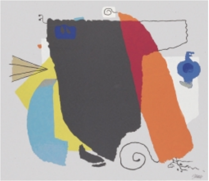
Willi Baumeister 1889 Stuttgart – 1955 Stuttgart Phantom, 1951 Farbserigrafie auf Büttenpapier 48 x 56 cm (65 x 76,5 cm) signiert u. r.: Baumeister; nummeriert u. l.: 9/70 Literatur: Heinz Spielmann / Felicitas Baumeister, Werkkatalog der Druckgraphik, Stuttgart 2005, Nr. 178