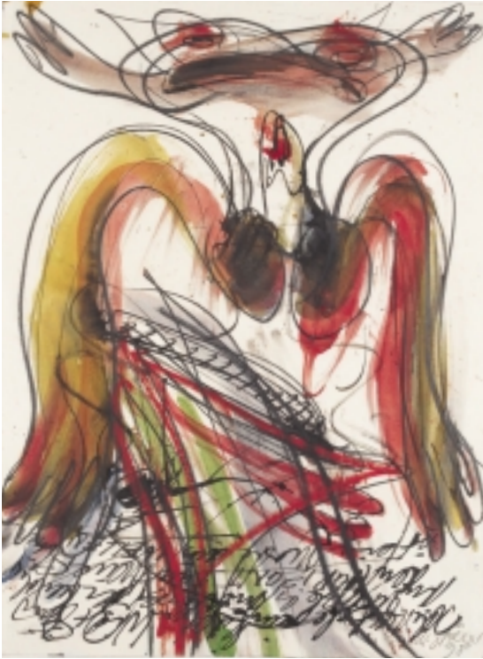
Walter Stöhrer 1937 Stuttgart – 2000 Berlin Ohne Titel, 1998 Gouache, Kohle, Graphit, Ölkreide und Tusche auf Büttenpapier 75 x 55,5 cm signiert und datiert u. r.: W. Stöhrer 98